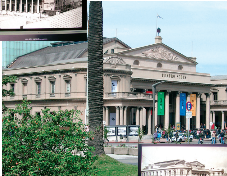
Teatro Solís - früher und heute